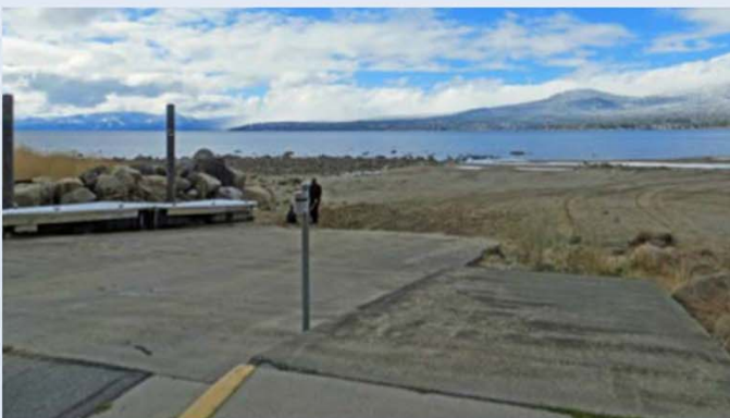
Condición de la rampa, 2015