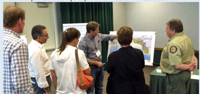
Taller público, septiembre de 2016

Por favor, reenvíele este boletín informativo a otras personas que puedan estar interesadas.